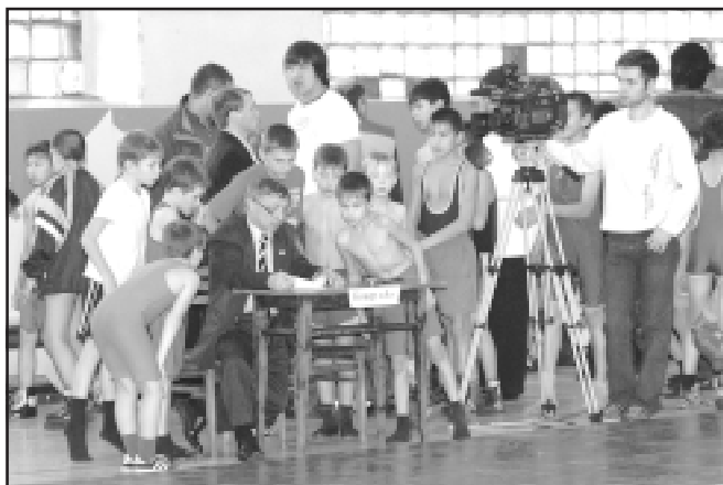
Что там в протоколе?

Многие мальчишки пришли на турнир со своими