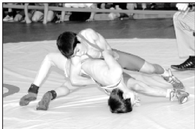
Мост - как средство обороны.

Ш ум и гам из спортивного зала комплекса «Портовик» слышны уже на крыльце – это проходит турнир по греко-римской борьбе, посвященный памяти Александра Кизима. Звонкие мальчишеские голоса перекрывают слова секретаря, объявляющего тех, кто сейчас выйдет бороться на ковер. А над всем этим гремит бас одного из тренеров, подсказывающего воспитаннику, как уложить соперника на лопатки. При этом представьте, что мальчишки в синих и красных костюмах беспрестанно перемещаются по залу, так что от многоголосья и разноцветья голова идет кругом.