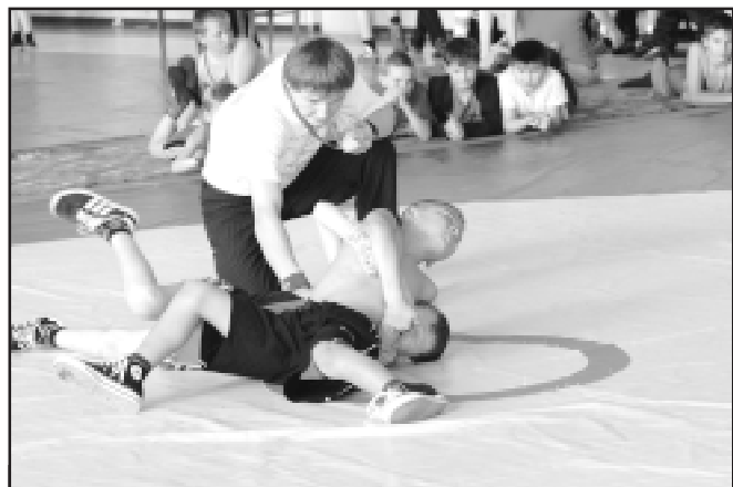
Без судьи не разберешься.