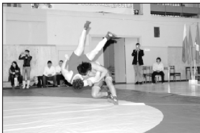
Раз - и бросок через плечо.

домом - кто-то с синяками, кто-то с царапинами. Одни увезли грамоты и медали, другие – поощрительные призы и горечь от первого проигрыша. В результате упорной борьбы дудинские ребята завоевали 12 золотых медалей, 9 серебряных и 11 бронзовых. Спортсмены из Носка заняли два вторых места и два третьих (немного не дотянули до